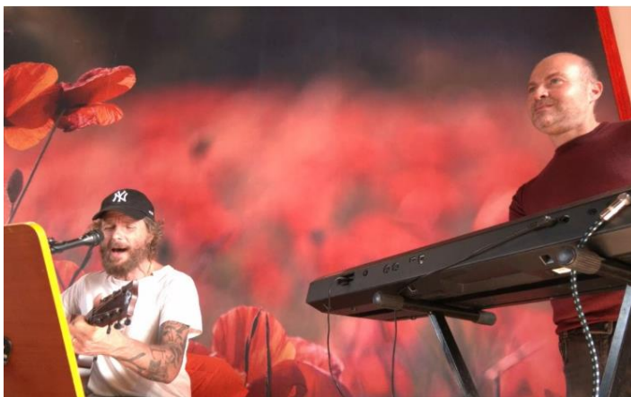
Un altro momento della mattinata allo Specchio