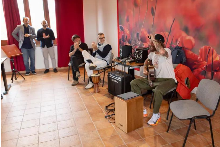
Jovanotti e Soldini nella comunità Lo Specchio

Il cantante e il velista incontrano gli ospiti del centro per il trattamento dei disturbi dell'alimentazione