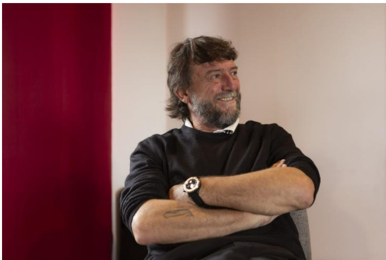
Giovanni Soldini ascolta divertito un commento di Jovanotti

«Bisogna avere il coraggio di prendere le decisioni per se stessi e non per far felice chi ti sta vicino», ha sottolineato a sua volta Soldini. «Avevo una strada già scritta: dopo il liceo, mi sarei dovuto iscrivere all'università per studiare giurisprudenza. Invece ho seguito il mio istinto, ciò che più mi piaceva e che avevo dentro. Quando lavoro, e vi assicuro che lavoro tantissimo, ogni tanto dico ai miei collaboratori: ma vi rendete conto che ci pagano per fare ciò che ci piace di più? I giornalisti spesso mi chiedono come faccia a navigare da solo tra gli iceberg del Polo Sud, in mezzo a tante insidie. Credo, però, che il vero coraggio consista nel fare le scelte giuste per noi: perché, quando uno fa delle scelte, inevitabilmente rinuncia ad altre cose. Non è semplice sapere se una scelta è giusta oppure no. Però ho sempre pensato che, se ti svegli contento la mattina ben sapendo che cosa ti aspetta, sei già sulla buona strada».