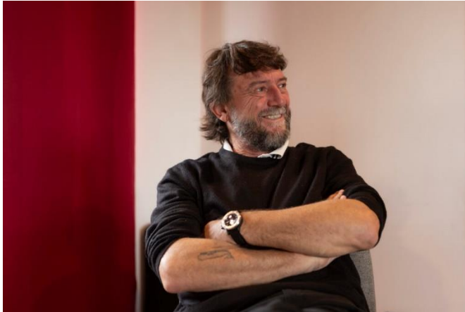
Il velista Giovanni Soldini ascolta divertito l'intervento di Jovanotti