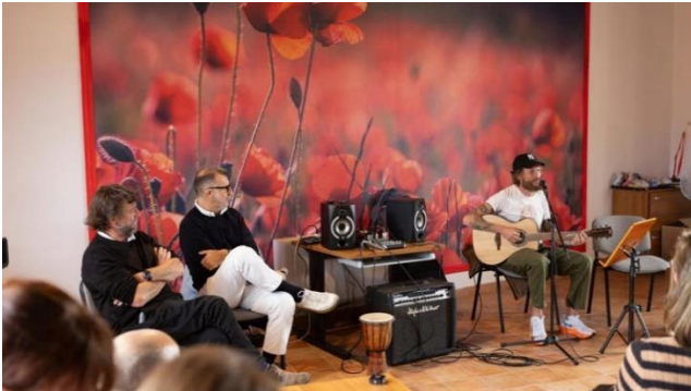
Domusnovas, visita a sorpresa di Jovanotti e Soldini alla comunità “Lo Specchio”