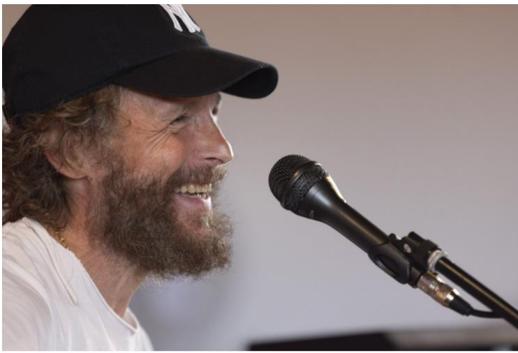
Jovanotti mentre dialoga con gli ospiti dello "Specchio"