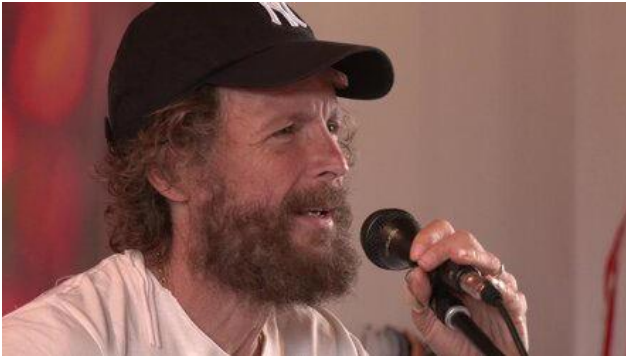
Domusnovas, visita a sorpresa di Jovanotti e Soldini alla comunità “Lo Specchio”